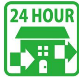
24 時間換気システム施設